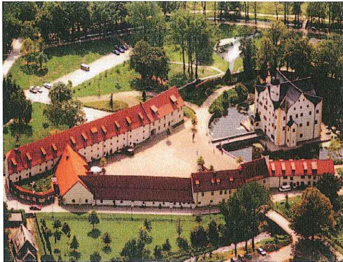
Schlosshotel Klaffenbach ****